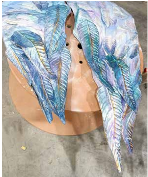
Luigia Bonamassa Cartapestaia