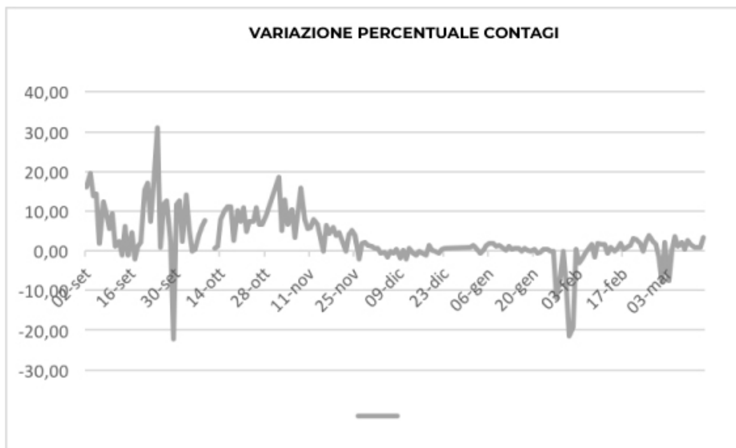
VARIAZIONE PERCENTUALE CONTAGI