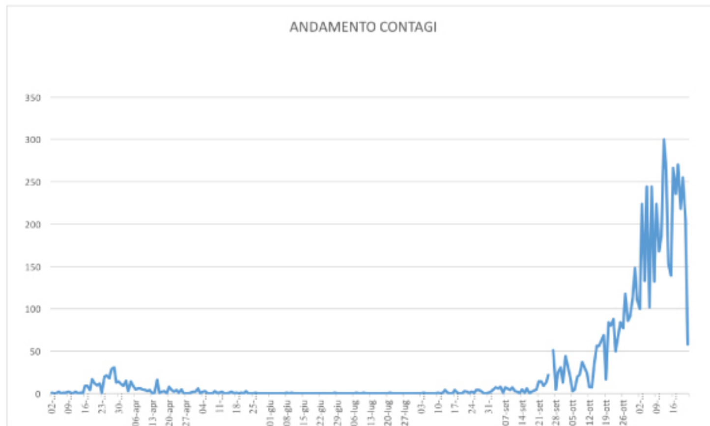
GRAFICO ANDAMENTO CONTAGI