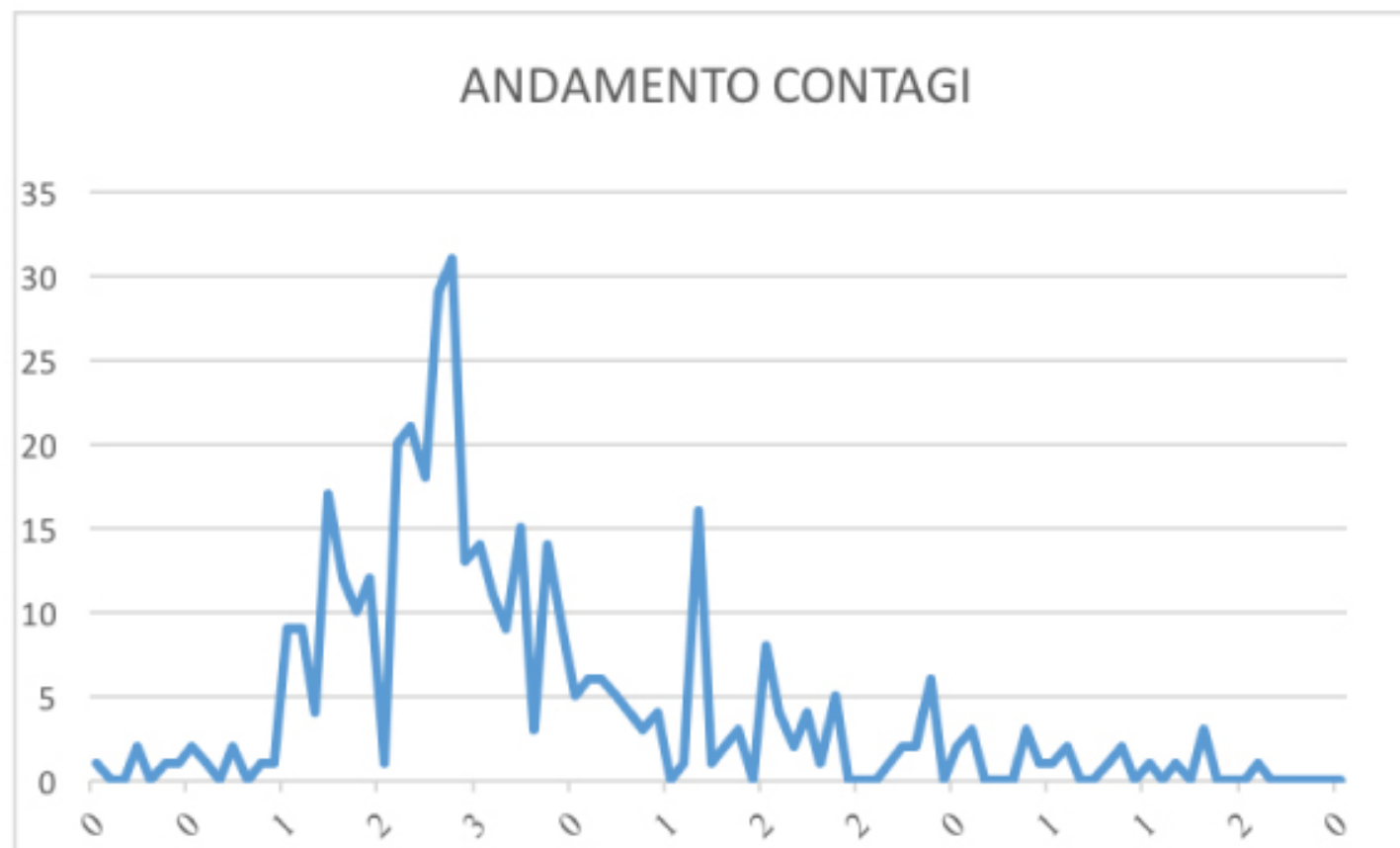
GRAFICO ANDAMENTO CONTAGI