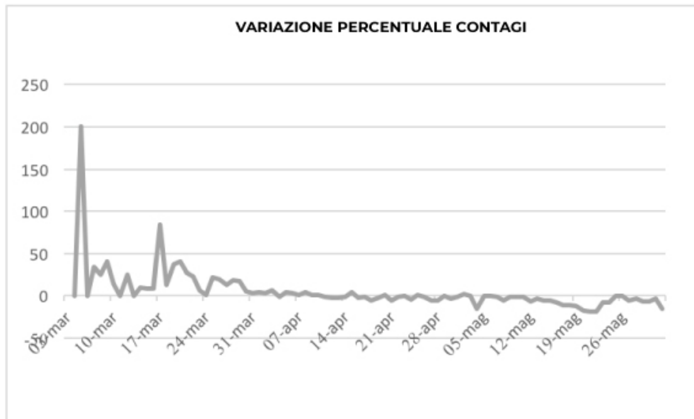
GRAFICO VARIATIONE PERCENTUALE CONTAGI