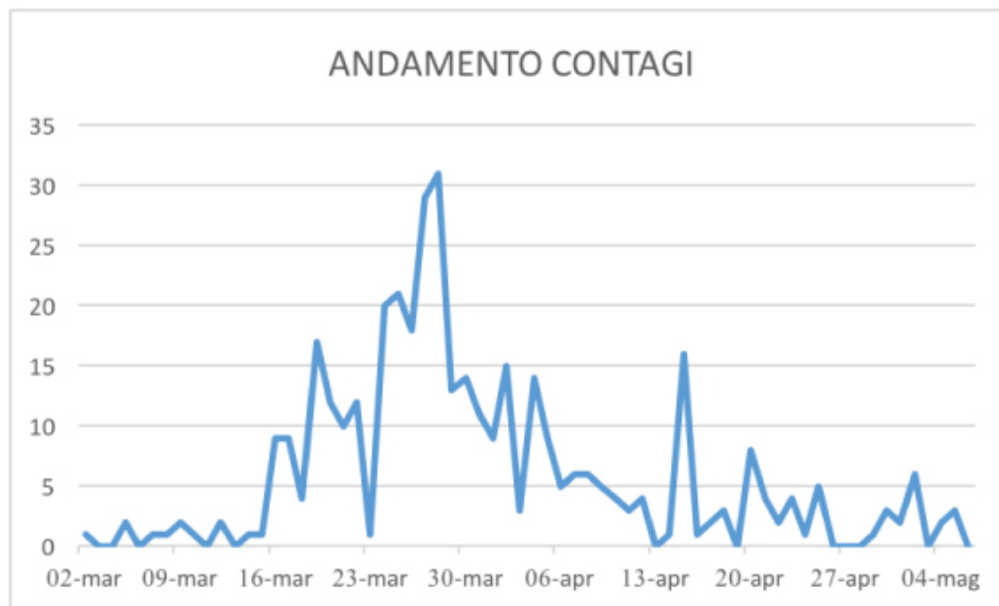
GRAFICO ANDAMENTO CONTAGI